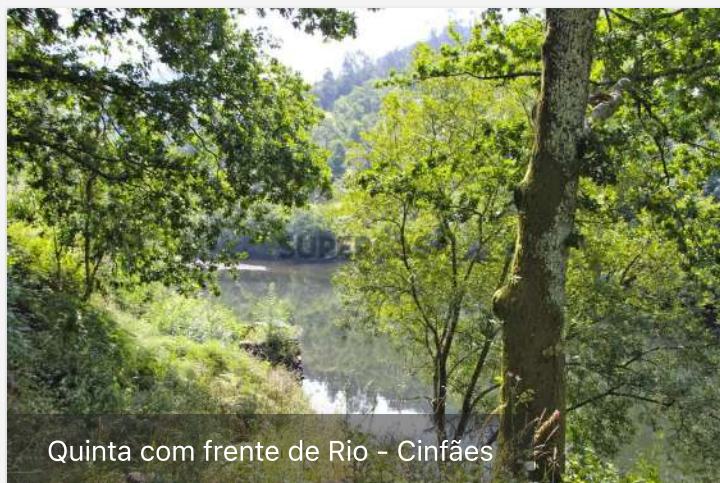
Quinta com frente de Rio - Cinfães