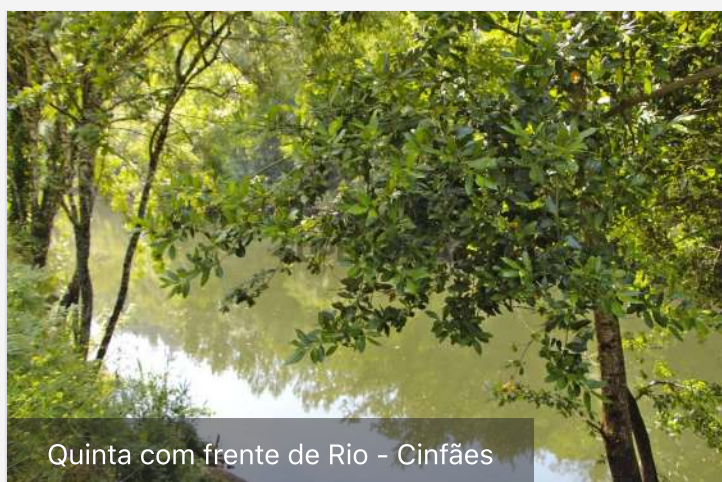
Quinta com frente de Rio - Cinfães