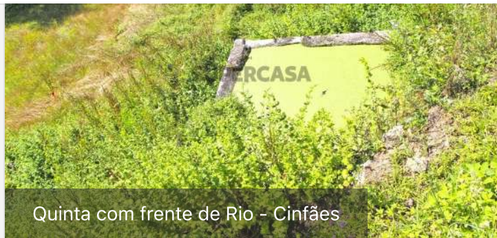
Quinta com frente de Rio - Cinfães