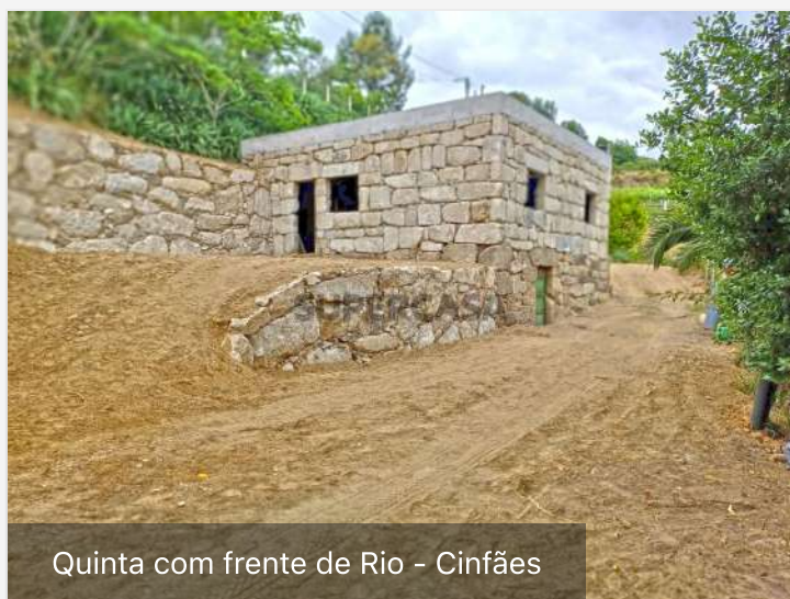
Quinta com frente de Rio - Cinfães