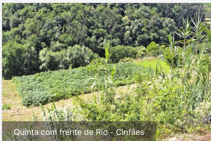
Quinta com frente de Rio - Cinfães