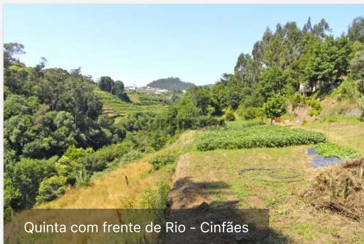
Quinta com frente de Rio - Cinfães