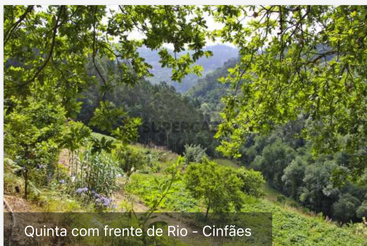
Quinta com frente de Rio - Cinfães